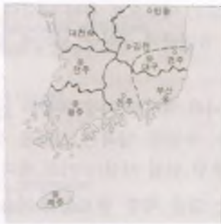
(4) 낙동강 전선