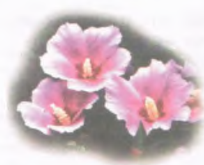
대한민국 국화 무궁화