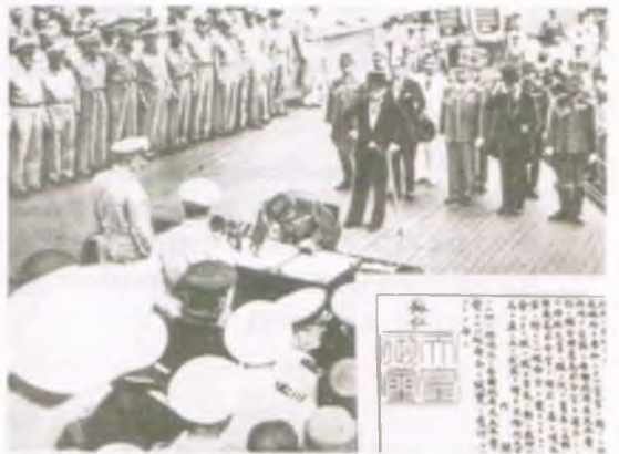
일본의 항복 조인식 광경

광복의 기쁨. 1945년 8월 15일, 일본의 통치에서 해방된 시민들은 손에 태극기를 들고 거리로 나와 만세를 부르며 기뻐 하였다.