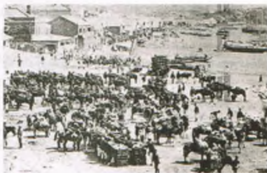
1894년 6월 12일 일본군이 인천에 상륙하고 있다

일본은 청일전쟁(1894~1895)과 러일전쟁(1904-1905)으로 동북아의 국제관계에 큰 영향을 주었는데, 이 두 전쟁은 한반도에 대한 이해의 상충으로 일어난 것이었다. 일본은 청일전쟁의 결과 다른 어느 나라보다도 먼저 한반도에 진출할 발판을 마련하였다. 그리고 청국과 일본 간의 강화조약으로 청국은 조선이 자주국임을 승인하였는데, 이것으로 일본은 앞으로 한반도에서 그들이 어떤 일을 하든 괜찮다는 양해를 청국으로부터 얻은 셈이다. 이와 같이 한반도에 진출할 발판을 마련한 일본은 대륙까지 침략