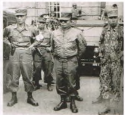
박정희 육군소장을 중심으로 한 청년 장교들이 군사혁명위원회의 포고령으로 전국에 비상계엄령을 선포, 정권장악