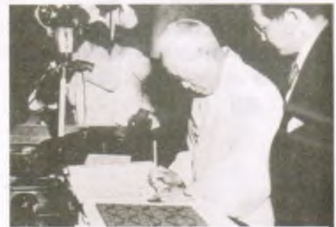
대한민국헌법에 서명하는 이승만