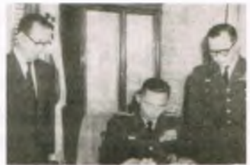
박정희 장군은 '국가 재건 최고 회의'를 조직하여 군정을 시작하였다.

6.25 사변 후 이승만 정권은 전쟁수행과 공산주의와의 대립을 핑계로 차차 독재정치를 펴 나갔다. 부산 피난 때 이승만이 조직한 자유당이 일당 독재로 강압 정치를 하므로 반대세력은 '범야당운동'을 벌여 이를 억제하려고 하였다. 그러나 이승만의 독재정치는 더욱 심해져 사회불안이 점점 더 커져 갔다. 독재정권에 대한 국민의 반감이 절정에 이르렀던 1960년 3월 15일 대통령 선거에서 자유당 정권은 경찰