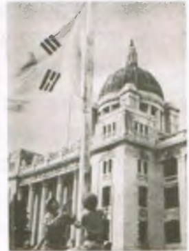
(6) 1950년 9월 27일, 서울이 북한 공산군에게 함락되고 3개월 만에 느껴보는 감격적인 순간