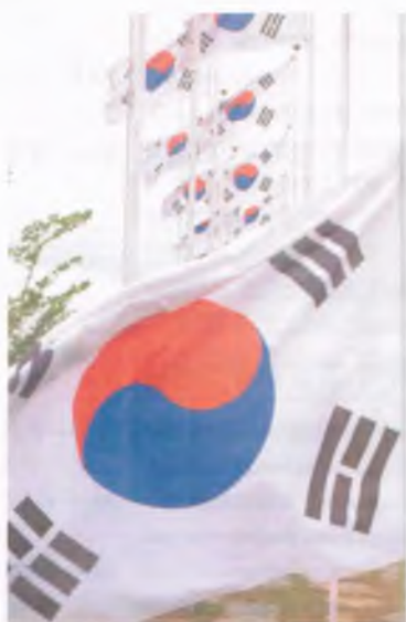
대한민국 국기 태극기