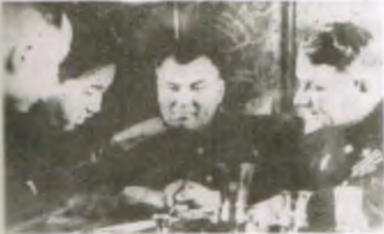
(1) 김일성에게 남침의 흥계를 지시하는 소련군 사령관. 김일성을 비롯한 북한 공산주의자들은 남침을 개시하기 전 소련의 도움을 받아가며 충분한 준비를 했다.