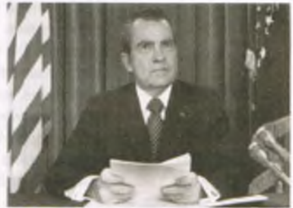
캄 선언을 한 닉슨 대통령

제2차 세계대전 이후로 미국은 대소봉쇄정책(對蘇封鎖政策)을 대아시아 정책의 기본 방향으로 삼았다. 그 결과 미국을 중심으로 하는 자유진영과 소련을 중심으로 하는 공산진영이 첨예하게 대립되는 냉전상황이 계속되었다. 미국은 월남전에 참전하여 실패하자 냉전적인 극한 대립관계가 한계에 이르렀음을 깨닫게 되었다. 그래서 닉슨(Nixon, R.M.) 대통령이 캄 선언(닉슨 독트린)을 발표함으로써 미국의 대아시아 정책은 커다란 변화를 맞게 되었다.