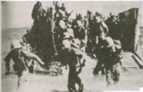
(5) 인천에 상륙하는 한국 해병대