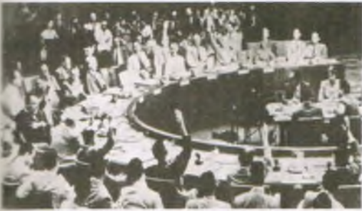
(3) 유엔안전보장 이사회 북한 공산군에 대한 응징을 결정하고 있는 순간이다. 유엔군의 파병은 유엔군이 창설된 이래 최초의 일이었다.