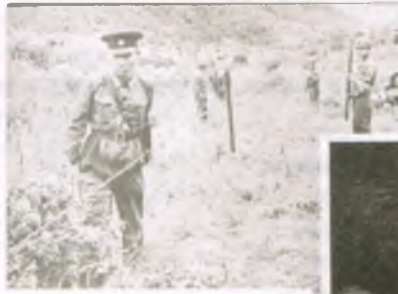
(7) 군사분계선 철조망 설치작업