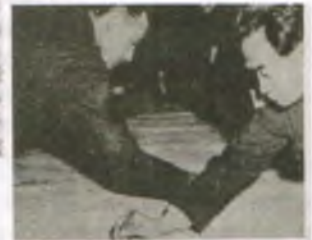
(8) 휴전선을 구획 짓는 유엔군과 공산군 측 대표