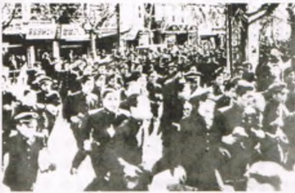
1960년 3월 15일 실시된 정부통령 선거를 부정선거라며 규탄하는 시민과 학생들의 시위가 서울, 부산, 마산 등지에서 발생하였다.