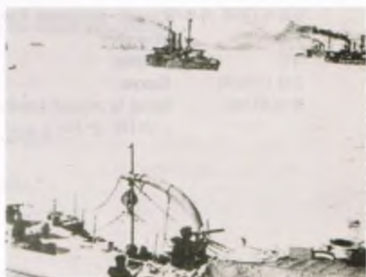
러일전쟁. 러시아함대가 나타나기를 기다리는 일본 함대