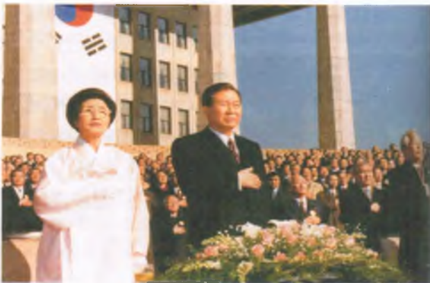
김대중 대통령 취임식

김대중 대통령 뒤를 이어 인권변호사로 이름을 날렸던 노무현 후보가 대통령에 당선되었다.