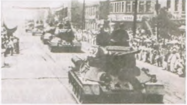
(2) 서울 시내로 진입해 들어오는 북한 공산군 탱크부대